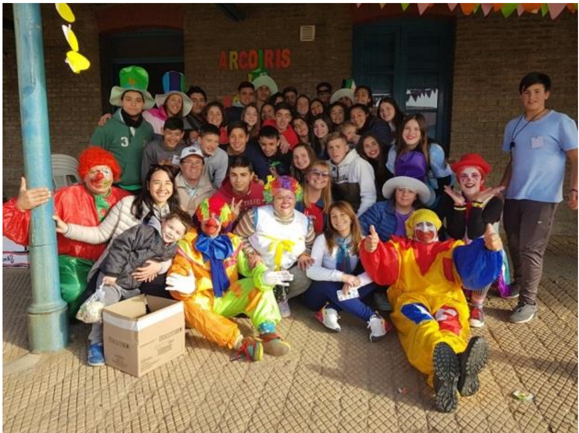
UNA TODOS JUNTOS!!!!!! GRACIAS I.P.D.P.E.C