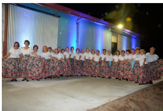
Taller El Escondido