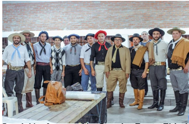
Comisión Agrupación Gaucha Posta El Lobatón