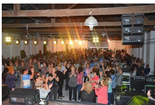
Nuevas instalaciones en el Sum