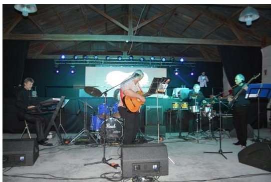
De Tal Palo

¡Compartimos con ustedes las imágenes que es sólo una síntesis de la gran noche que vivimos juntos en el Sum del Centenario! Gracias a todos los que participaron de la Fiesta de la Fe y la Tradición. Celebramos el cumpleaños del Ballet Sonkoy Argentino y reconocimos el trabajo de la Agrupación Gaucha Posta El Lobatón. En un espacio físico colmado de público, con mayores comodidades, transcurrieron casi 6 horas a puro folclore. ¡Viva la Cultura! Trabajo en equipo, solidaridad, camaradería, tradiciones, y aplausos! Esta fiesta tuvo su continuidad el domingo 26.