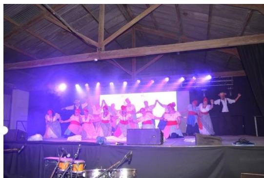
Ballet Sonkoy Argentino