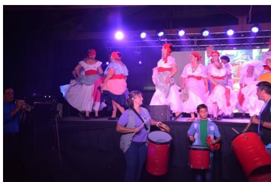
Cuadro Afro junto a Batucada